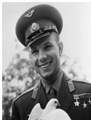
Ю. А. Гагарин

12 апреля 1961 года весь мир узнал имя советского гражданина Юрия Гагарина, совершившего орбитальный полёт вокруг Земли. За последующие четверть века в космосе побывали 60 советских космонавтов. Все они – Герои Советского Союза, а более половины из них этого звания удостоились дважды.